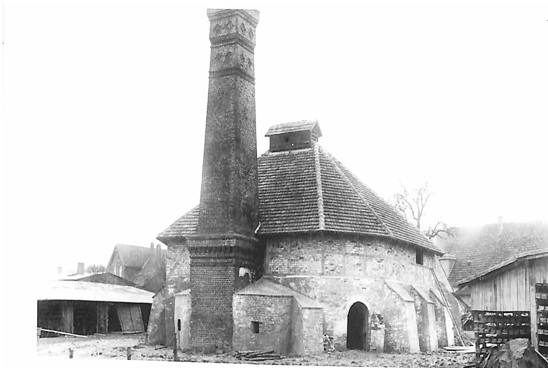
1937 - Stadtziegelei auf der Klosterseite

Hervorragende Bauten wie die Kloster- und Stadtkirche, die mit Ziegeln der Klosterziegelei hergestellt wurden, künden heute von der hohen Qualität der Erzeugnisse.