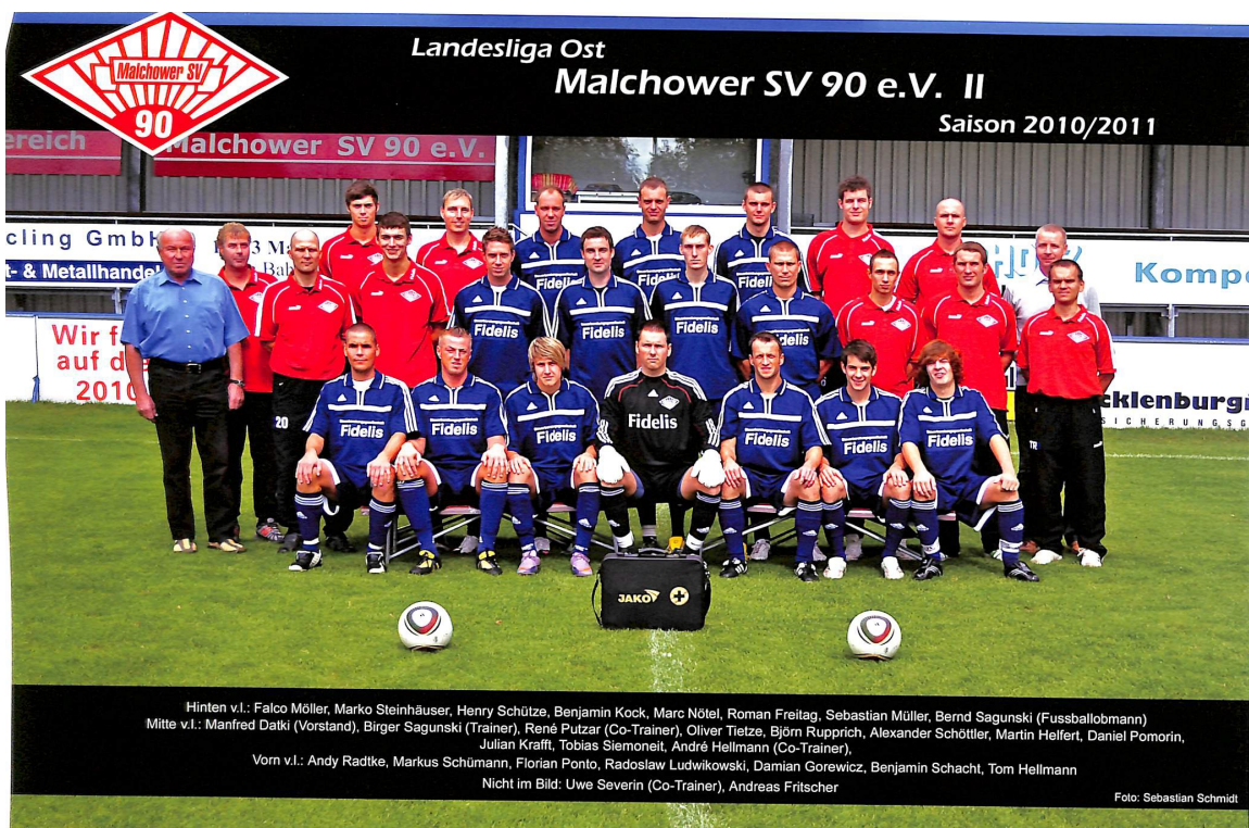
Fußballmannschaft der MSV 90

Da der Fußball in Malchow in der Geschichte des Malchower Sports schon immer eine besondere Rolle gespielt hat, nimmt er auch in dieser Broschüre einen großen Stellenwert ein. Das Heft 12 erschien schließlich anlässlich des 100-jährigen Bestehens des Malchower Fußballsports im Jahre 2011. Mit vielen Fotos, Abbildungen und Textbeiträgen wird die wechselhafte Erfolgsgeschichte des Malchower Fußballs von den Autoren Karl Stolle und Dieter Bohl belegt.