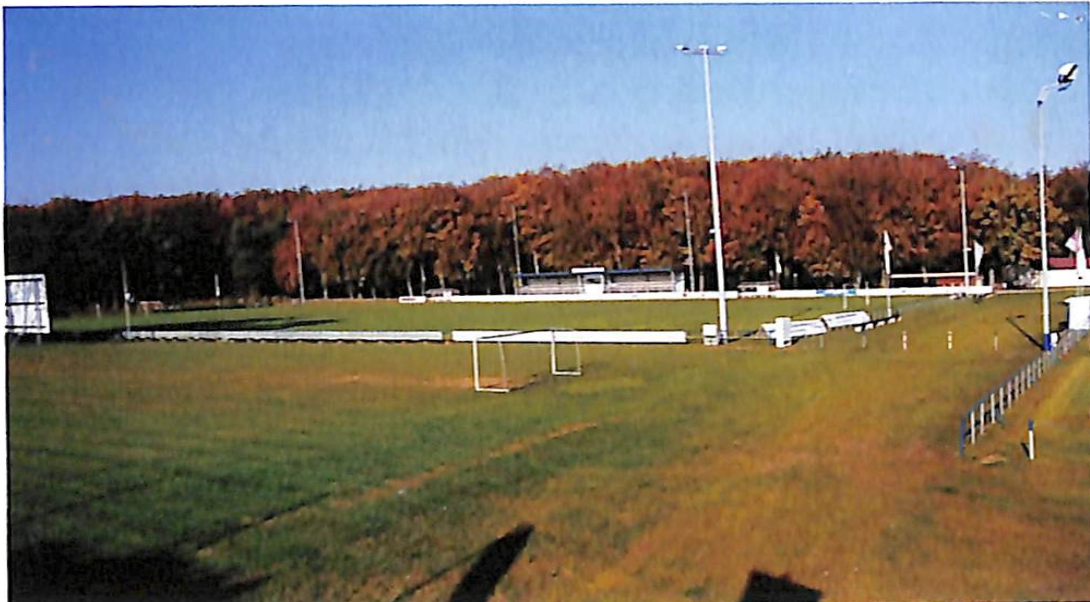
Spielfeld auf dem Waldsportplatz