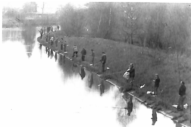
Anangeln Lenzer Kanal

1.1 Der „ Malchower Sportverein 1991 e.V.“ geht aus der Ortsgruppe des DAV hervor, der am 25. Mai 1954 gegründet wurde. Autoren: Wolfgang Gohlke und Klaus Eichmann