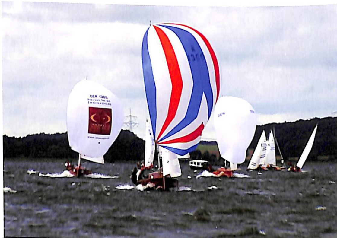
Internationale Deutsche Meisterschaft 2007 in Malchow